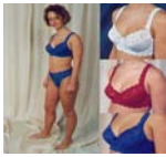
3-011 (3,95 €)